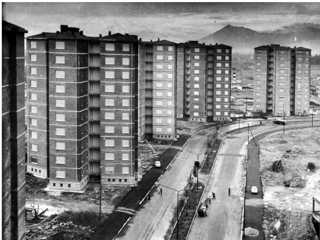
Case in costruzione, Vallette, da MuseoTorino