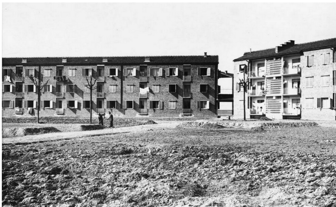
Case INA Falchera vecchia