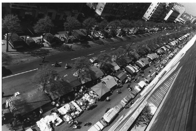
Mercato Santa Rita - Sebastopoli